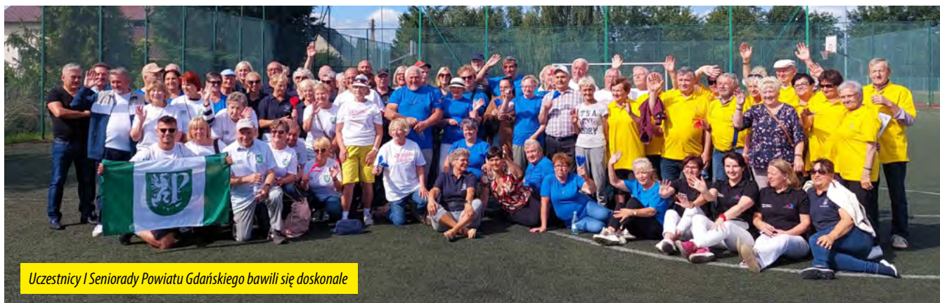
Uczestnicy I Senioriady Powiatu Gdańskiego bawili się doskonale

▶▶▶ W Starostwie Powiatowym w Pruszczu Gdańskim odbyło się spotkanie władz powiatu z wójtami gmin wchodzących w skład Powiatu Gdańskiego oraz wiceburmistrzem Miasta Pruszcz Gdański. Podczas spotkania poruszono wiele istotnych tematów – rozmawiano m.in. o transporcie publicznym, powstaniu pilotażowego oddziału urazowego oraz o wspólnych inwestycjach.